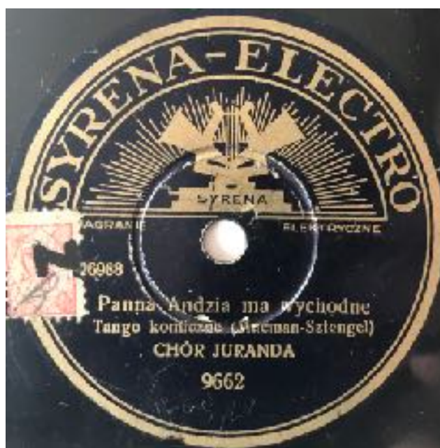
Il. 12. Etykieta płyty Syrena-Electro.

W repertuarze orkiestry znajdują się piosenki ukazujące życie proletariuszy i przedstawicieli niższych warstw społecznych. Do takich należy piosenka Panna Andzia ma wychodne , znana przed wojną w wykonaniu Chóru Juranda i nagrana przez ten chór rewelersów na płyty gramofonowe Syrena-Electro w wytwórni Syrena-Record w maju 1936 roku (Syrena-Electro 9662, matryca: 27092) 40 . Piosenka nie posiada nacechowań gwarowych, chociaż traktuje o życiu proletariuszy i tematycznie porusza kwestie obyczajowości miejskiej prostego ludu.