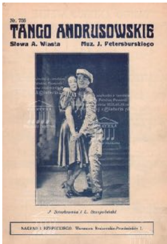
Il. 10. Okładka nut Tanga andrusowskiego . Źródło: bibliotekapiosenki.pl 12 .

jazda, panie, lu!” 13 . Monopolka, właściwie monopolica - to wódka monopolowa, jedna z przyjemności wymienionych przez podmiot liryczny w refrenie. Co więcej, podmiot wartościuje przyjemności wymieniając kolejno polkę Szabasówkę , wódkę monopolową, a następnie tango - podając go jako przyjemność nadrzędną, wobec którego wszystko inne schodzi na dalszy plan - „lecz przy tangu niech ją kolka” 14 . Kolejnymi wyrażeniami gwarowymi w piosence są: niech cię kolka - żartobliwe przekleństwo oraz strugać wariata - udawać wariata 15 .